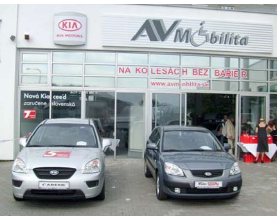
AV Mobilita disponuje non-stop bezplatným call centrom, ktoré si pochvaľujú aj znevýhodnení zákazníci.

O integráciu znevýhodnených občanov do spoločnosti sa snaží nielen ich zamestnávaním, ale aj posilňovaním integrovaného prístupu všetkých zainteresovaných strán k odstraňovaniu bariér pre vstup znevýhodnených na trh práce. Okrem toho sa im snaží uľahčiť život organizovaním spoločenských stretnutí a podujatí, kde majú priestor na vzájomné zoznámenie, pomáha im so zabezpečením liečebných pobytov a formou inkubátora ich podporuje v podnikaní.