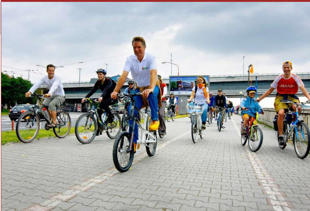
Európsky týždeň mobility 2011 s ústrednou témou „alternatívna mobilita“ sa blíži...

ale pravidelne. Sektor by sa však mal zaoberať aj otázkami, ako zabrániť znížovaniu morálnych a etických hodnôt v médiách pri pracovných postupoch, samotných článkoch a témach, o ktorých médiá podávajú správy.