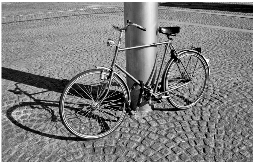
Európsky týždeň mobility je za dverami ...

V Moldave nad Bodvou, ktorá sa do týždňa mobility zapája po prvýkrát, majú pripravených množstvo aktivít, medzi nimi aj Kolieskomániu – súťaž na kolieskach všetkých druhov, ktorou sa slávnostne otvorí týždeň mobility, Bicykel fest , enviro-prednášky alebo dokonca módnu prehliadku bicyklov. Ponuka podujatí je naozaj pestrá, tak neváhajte a roztočte to aj vy na eko-kolesách!